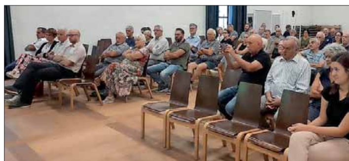
Zahlreiche Zuhörer verfolgten die Infoveranstaltung der Bezirksgemeinschaft Wipptal über Energiegemeinschaften.

Im Dezember 2021 legte Italien per Gesetzesdekret den Grundstein für die Entstehung von Energiegemeinschaften. Für die Gründung von gemeindeübergreifenden Energiegemeinschaften fehlen aber die Durchführungsbestimmungen. Insbesondere die Förderung von 12 Cent pro Kilowattstunde ist noch nicht genau definiert. Von dieser hängt aber vielfach die Rentabilität der Energiegemeinschaft ab, erhofft man sich nämlich, dadurch die Ver-